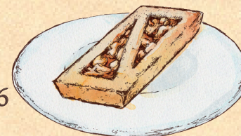
フィナンシェ クルミっ子