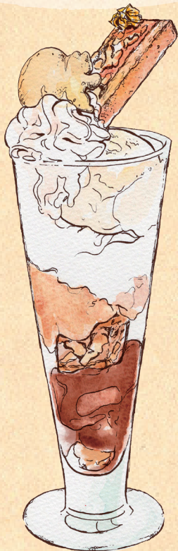
クルミっ子パフェ

コーヒージュレ、チョコレートムースの上に ローストしたクルミとサブレのパウダーを 散らし、塩キャラメルアイスとミルクアイスを 添えてクルミっ子のイメージを パフェで再構築しました。